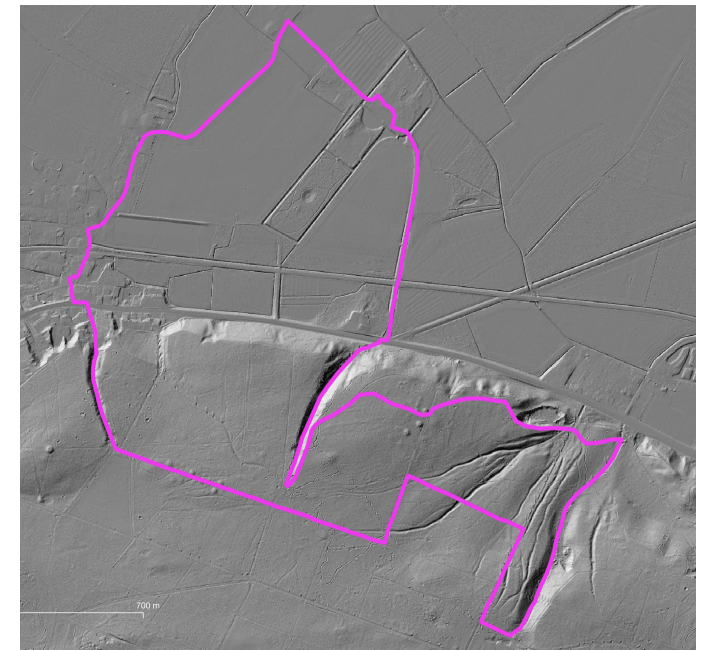
Afbeelding 1: reliëfkaart van geopad DE-03