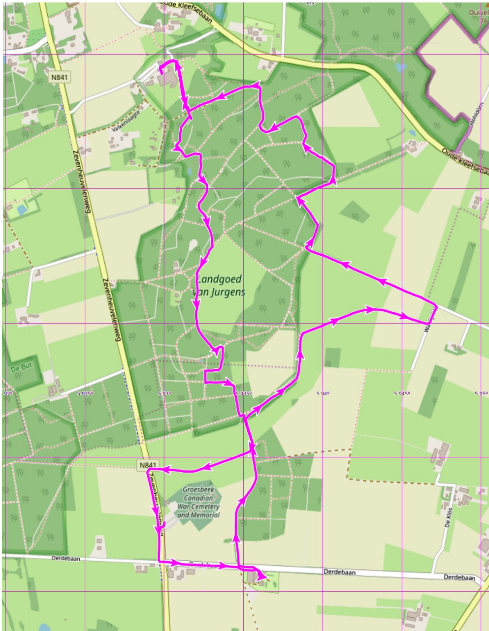
Afbeelding 1: topografische kaart van geopad NL-06