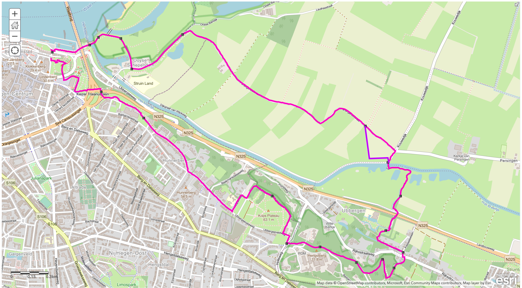
Afbeelding 1: topografische kaart van Geopad NL-09