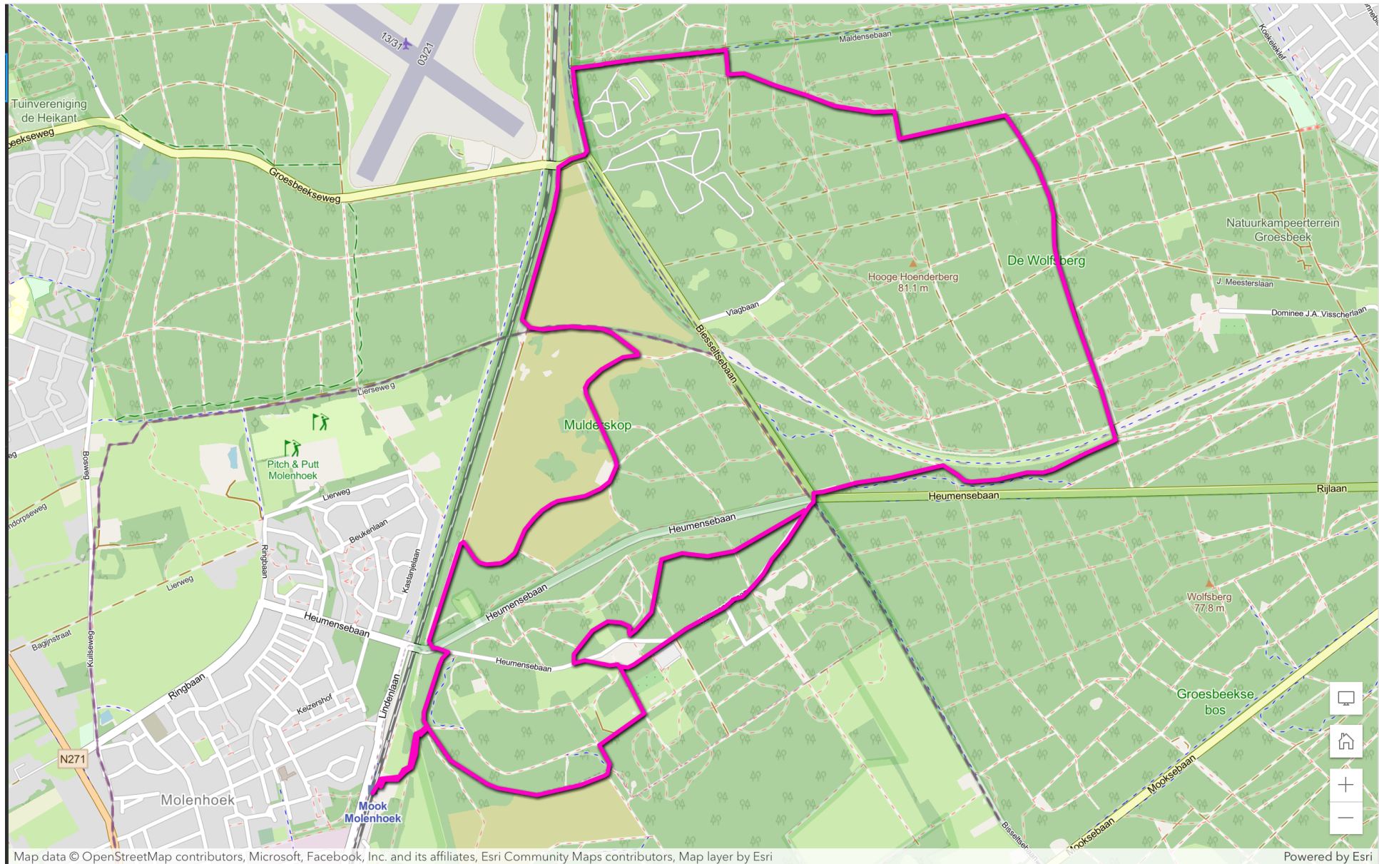
Afbeelding 1: topografische kaart van Geopad NL-03