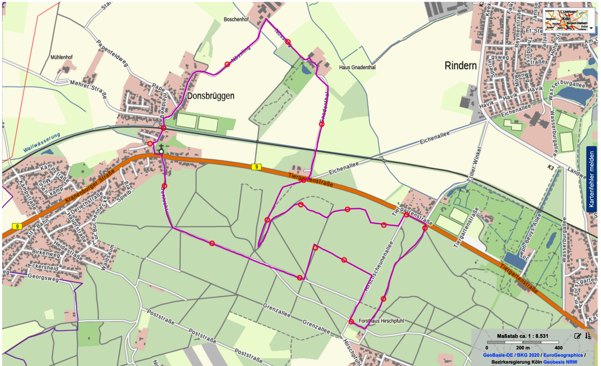
Afbeelding 1: topografische kaart van Geopad DE-03